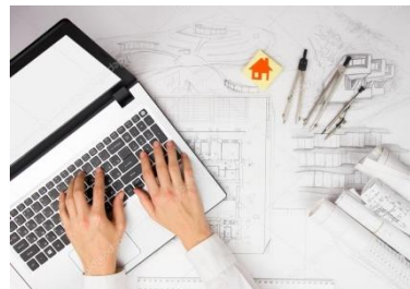
ФАЙЛЫ ДЛЯ ПРОФЕССИОНАЛОВ

Материалы доступны для скачивания по следующим ссылкам: