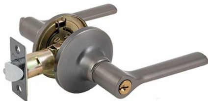
Защелка Avers 8083-01-GRF