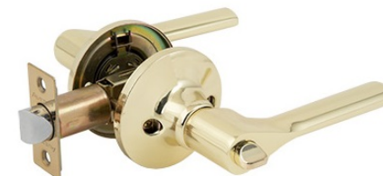
Защёлка Avers 8083-03-G

Код товара: 31333 Новинка! Цвет: CR – хром