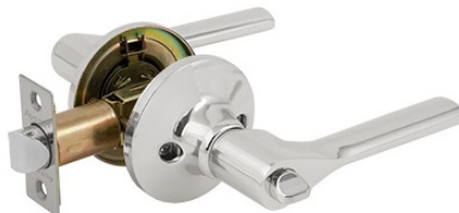
Защёлка Avers 8083-03-CR

Код товара: 31330 Новинка! Цвет: AB – бронза