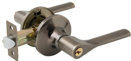
Защелка Avers 8083-01-AB