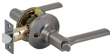
Защёлка Avers 8083-03-GRF

Код товара: 31335 Новинка! Цвет: G – золото