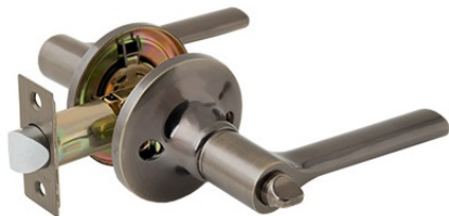
Защёлка Avers 8083-03-AB

Код товара: 31330 Новинка! Цвет: AB – бронза