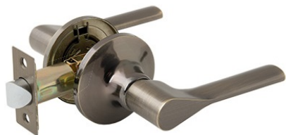
Защелка Avers 8083-05-AB

Код товара: 31331 Новинка! Цвет: AB – бронза