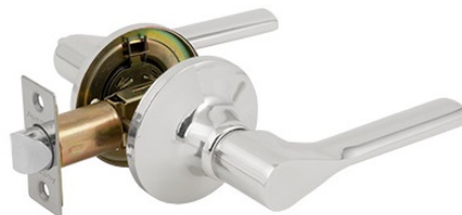
Защелка Avers 8083-05-CR

Код товара: 31331 Новинка! Цвет: AB – бронза