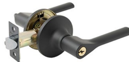
Защелка Avers 8083-01-BLM