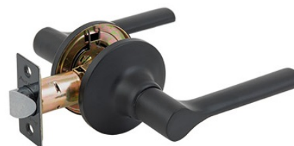
Защелка Avers 8083-05-BLM

Код товара: 31727 Новинка! Цвет: GRF – графит