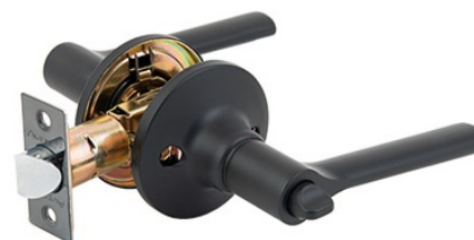
Защёлка Avers 8083-03-BLM

Код товара: 31726 Новинка! Цвет: GRF – графит