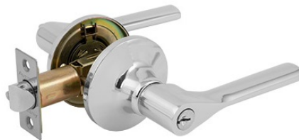
Защелка Avers 8083-01-CR