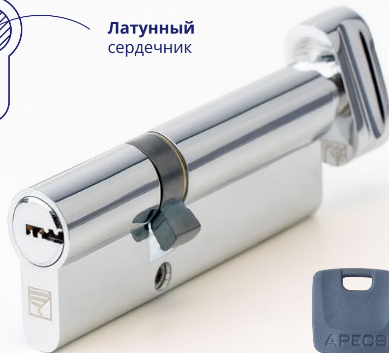
Удобная пластиковая головка ключа